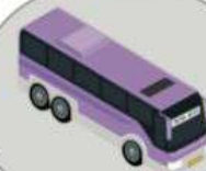
Автобус междугородного/международного следования

Проявите гражданскую позицию, поддержите «Стратегию Ноль» в России. Поделитесь с друзьями и близкими той информацией, которая показалась вам важной. Сделайте фотографию и разместите в VK Instagram Facebook #СТРАТЕГИЯНОЛЬ и #РОССИЯБЕЗДТП